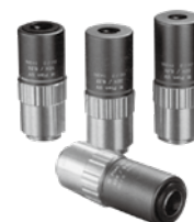
M Plan UV 明視野用紫外線補正