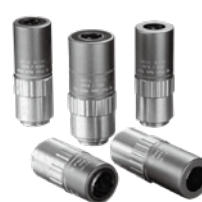
M Plan Apo NUV 明視野用近紫外線補正