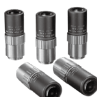
LCD Plan Apo NIR 明視野用液晶近紅外線補正