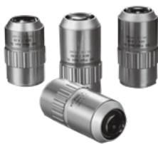
BD Plan Apo SL 明暗視野用超長作動距離