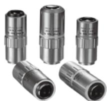
M Plan Apo SL 明視野用超長作動距離